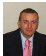
a cura di Franco Paduano

La crisi finanziaria sta lasciando i suoi segni anche sul settore dei prestiti, almeno in Italia: i primi sei mesi del 2010 hanno infatti registrato un calo del 5% rispetto allo stesso periodo del 2009, sulla domanda di prestiti personali e prestiti finalizzati da parte delle famiglie.